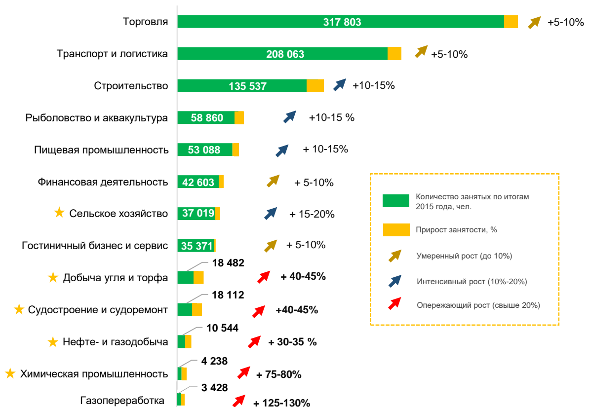
График 1 – потенциал роста рынка труда по отраслям

Потенциал прироста рынка труда отрасли до 2021 г. рассчитывается по отношению к количеству занятых по итогам 2015 г.